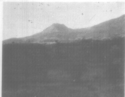
Tierras ubérrimas de Santa Fe. Al fondo yergue su cresta el cerro Tute.