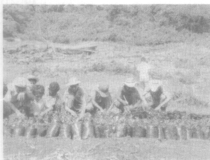
Vivero de la Escuela Alto de la Piedra, en plena selva de la región norte santafereña.