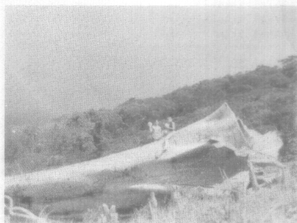
Tronco de uno de los múltiples árboles legendarios que pueblan las selvas santafereñas.

Las naranjas de Santa Fe sin ser injertadas, rivalizan con las de Boquete en dulzura y abundancia de jugo.