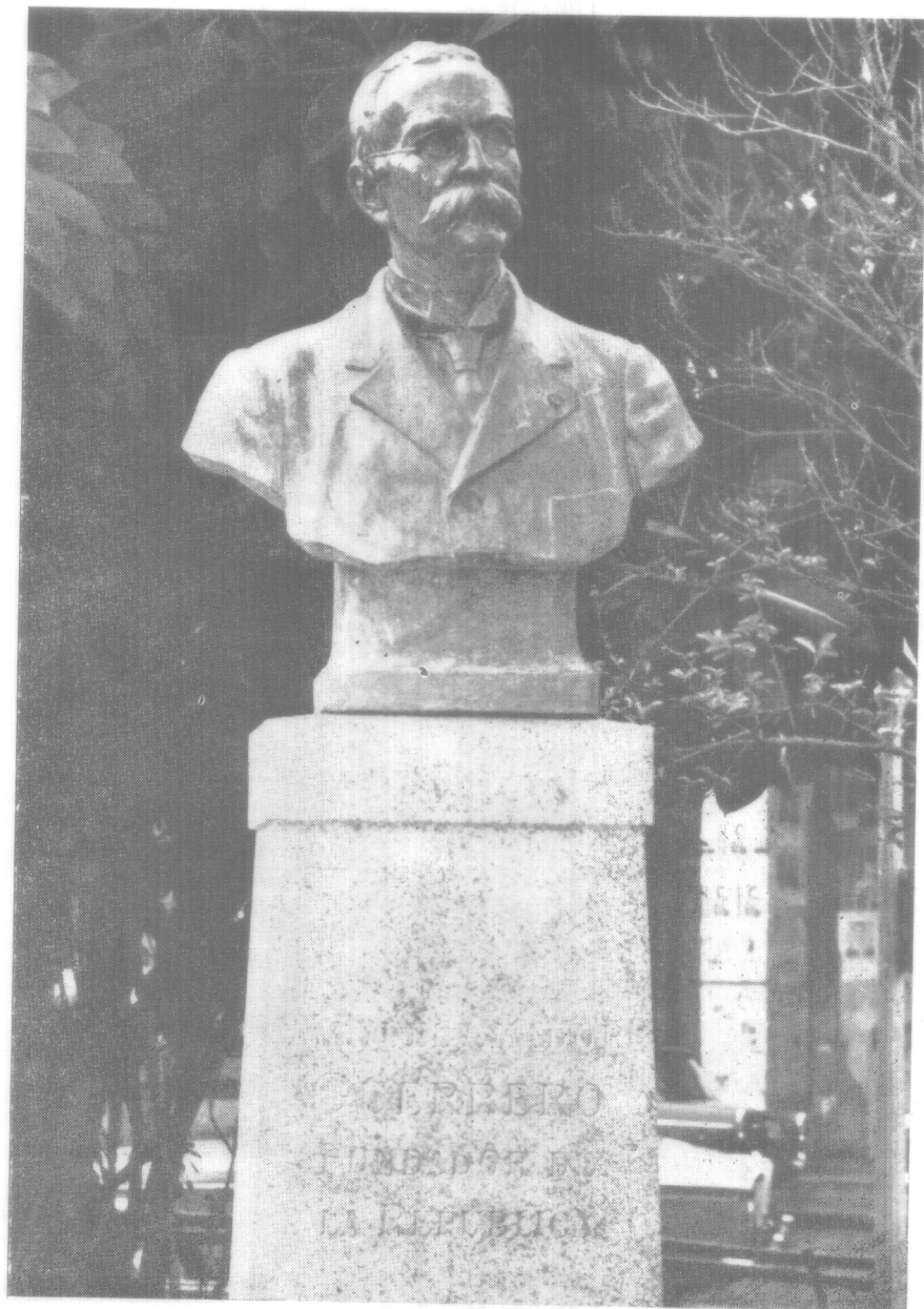
DR. MANUEL AMADOR GUERRERO (1833 - 1909) Busto en la Plaza de la Independencia