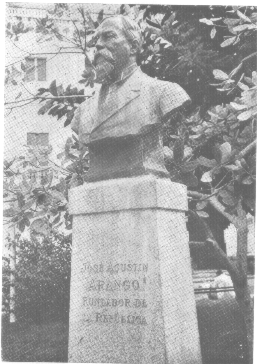
DON JOSE AGUSTIN ARANGO (1841 - 1909) Busto en la Plaza de la Independencia