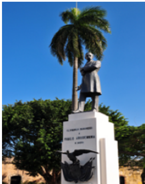
Estatua de Pablo Arosemena Las Bóvedas en la Plaza de Francia del Casco Antiguo o Casco Viejo de la Ciudad de Panamá