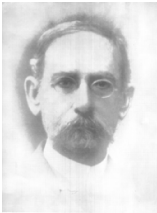
Dr. PABLO AROSEMENA