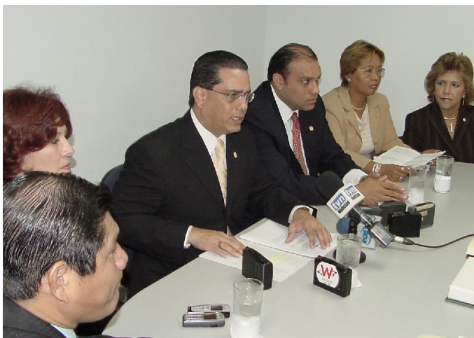
Comisión de Derechos Humanos en el 2006.

El nuevo Reglamento adicionó un nuevo artículo, el 41-A, que facultaba a los miembros de las Comisiones Permanentes de la Asamblea Legislativa citar a cualquier Ministro de Estado, Director General de Entidad Autónoma o Semiautónoma y otros para tratar asuntos de la Comisión. Para ello se necesitaba tener la aprobación de la mayoría de sus integrantes. Este artículo se fundamentaba en el artículo 155 de la Constitución Política de la República. Los funcionarios requeridos estaban obligados a asistir a las respectivas citaciones, cuando sean citados.