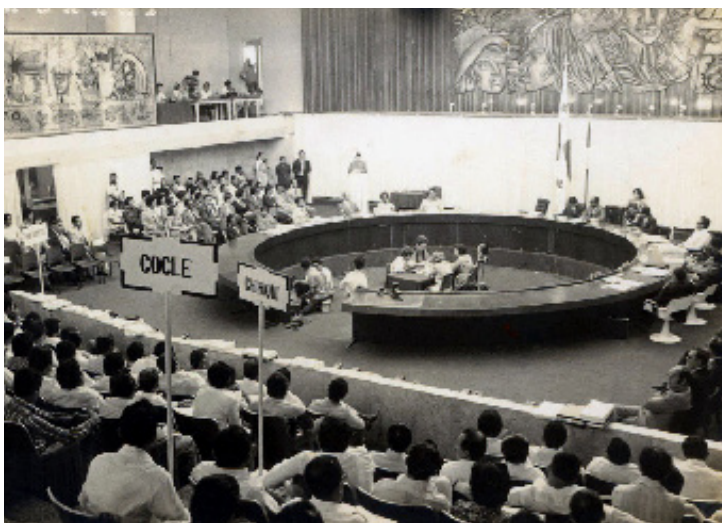
Vista de las Reuniones de las Asamblea Nacional de Representantes en sus sesiones en el Palacio Justo Arosemena.

Para ser Representante se requería ser panameño de nacimiento o nacionalizado diez años antes de la elección, tener dieciocho años de edad, no haber sido condenado por delito contra la cosa pública, la libertad o la pureza del sufragio y ser residente en el Corregimiento en que se postulaba, por lo menos un año antes. Para ser miembro de la Comisión de Legislación exigían los mismos requisitos que se le solicitaba a un Ministro: ser panameño por nacimiento, tener veinticinco años y no haber sido condenado contra la cosa pública.