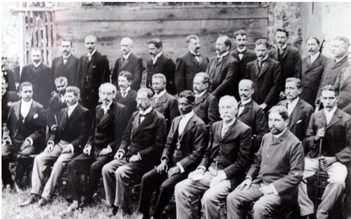
Miembros de la Convención Nacional Constituyente, 1904

realizan sólo un examen somero de los proyectos de ley, y las comisiones permanentes desempeñan funciones limitadas de fiscalización.” 25