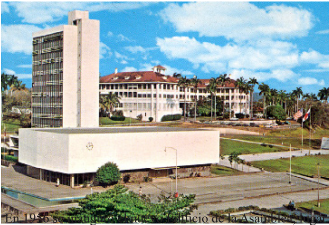
En 1946 se inauguró el antiguo edificio de la Asamblea Nacional donde funciona en la actualidad.