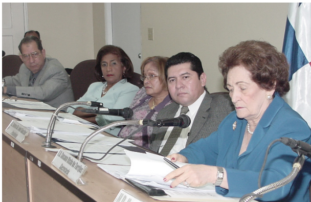
Directiva de la Comisión de Presupuesto en el año 2006.

La Comisión de Asuntos Agropecuarios y Conservación del Medio Ambiente fue regulada con ocho funciones o acápite mejorando la redacción de los anteriores y eliminando los acápite 9, 10 y 11 del Reglamento de 1979, que se referían a temas relacionados con el Canal.