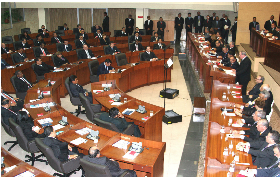
El H.D. Elías A. Castillo G., Presidente de la Asamblea en el Año del Centenario, cuando se dirige al Pleno de la Asamblea Nacional.

En el año 2010 se aprobó la Ley 1 del 2 de septiembre del 2010, que modifica el Reglamento Orgánico de la Asamblea y reduce el número de las comisiones permanentes de 21 a 15, quedando así: 1) Credenciales, Reglamento, Ética Parlamentaria y Asuntos Judiciales. 2) Gobierno, Justicia y Asuntos Constitucionales. 3) Presupuesto, 4) Economía y Finanzas. 5) Comercio y Asuntos Económicos. 6) Infraestructura Pública y Asuntos del Canal. 7) Educación, Cultura y Deportes. 8) Trabajo, Salud y Desarrollo Social. 9) Comunicación y Transporte. 10) Relaciones Exteriores. 11) Asuntos Agropecuarios. 12) Asuntos Indígenas. 13) Población, Ambiente y Desarrollo. 14) De la Mujer, la Niñez, La Juventud y la Familia, y 15) Asuntos Municipales.