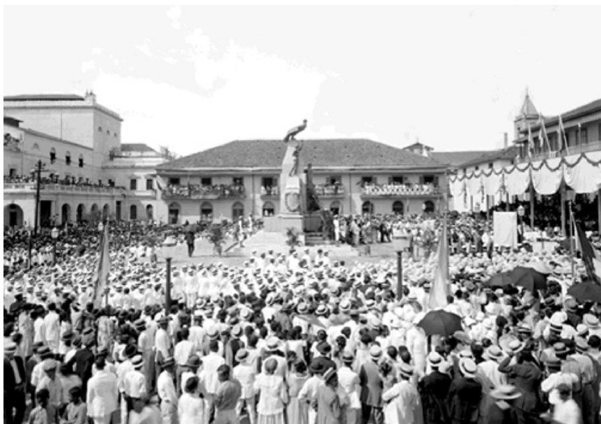
Inauguración de la Plaza Bolívar en el Barrio de San Felipe, donde funcionaba el Gobierno Nacional y la Asamblea.

cargos de Dignatarios de la Asamblea se elegían cada 30 días. Por otro lado, las Comisiones Permanentes definidas por la Comisión de la Mesa en cantidad, nombre y composición funcionaron durante todo el periodo en el que funcionó la Asamblea Constituyente. A estas Comisiones les correspondía “preparar los negocios ordinarios