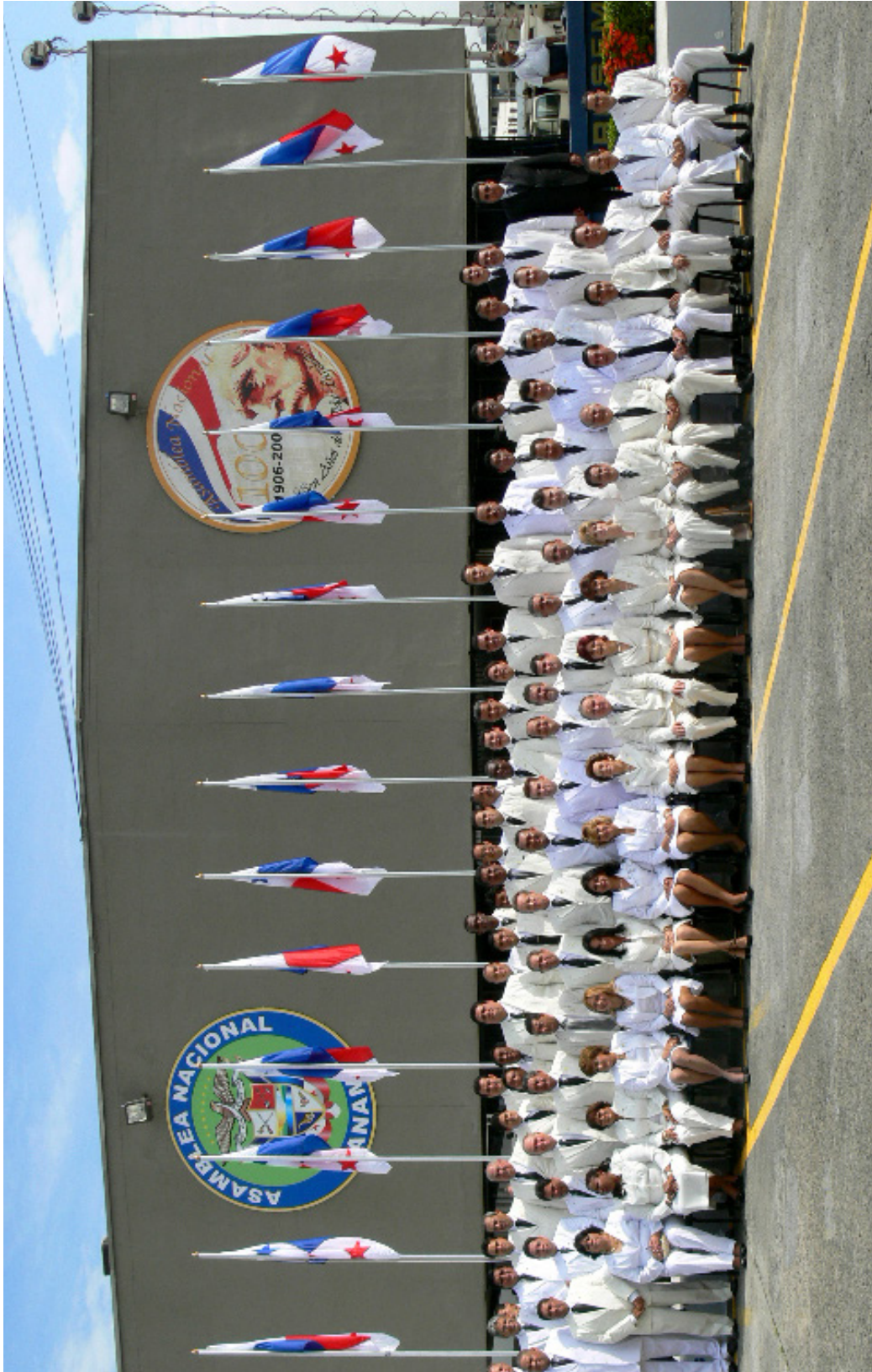
Diputados de la Asamblea Nacional en el año de su Centenario 2006