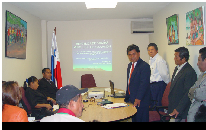
La Comisión de Asuntos Indígenas fue creada a finales del siglo XX. Vista de una sesión de trabajo de la Comisión en el año 2006.

ARTÍCULO 6: El artículo 65 del Reglamento Interno de la Asamblea Legislativa, que comprende la Ley 49 de 1984 y la Ley 7 de 1992 queda así: