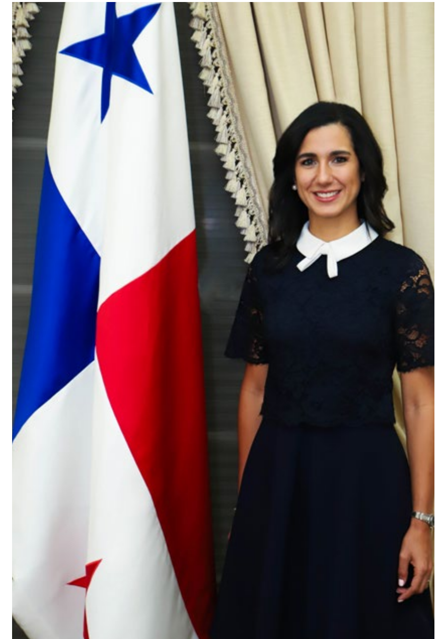
Michelle Muschett Ministra de Desarrollo Social