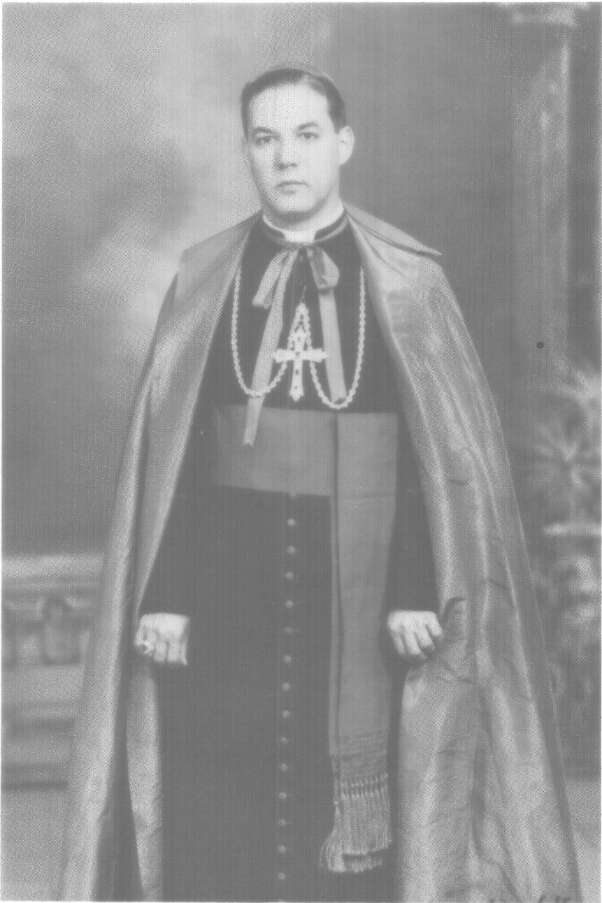
EXCMO. MONSEÑOR JOSÉ CARRIZO VILLARREAL