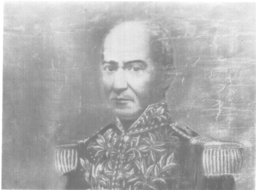
JOSE DOMINGO ESPINAR General Panameño (1791-1865)

Daniel Florencio O’Leary, que en 1823 y 1824 cumple en Santiago de Chile una delicada misión diplomática, adquiere entonces para Bolívar obras de Vattel, Locke, Robertson, Voltaire, Las Cases, Montholon, Humboldt, y muchos otros autores; mas como faltan las ocasiones de remitírselas con seguridad al Perú, las lee entre tanto el Edecán, para serenar su ánimo dolorido e irritado entre una y otra de las infructuosas gestiones que realiza ante el Supremo Director de Chile. Años más tarde, a comienzos de julio de 1826, hallándose en marcha hacia Bogotá, O’Leary dirige a Santander una carta en la cual recuerda las palabras que Virgilio puso en boca de Eneas al narrar el héroe troyano sus desventuras a la reina Dido: “Infandum, Regina, jubes renovare dolorem”;