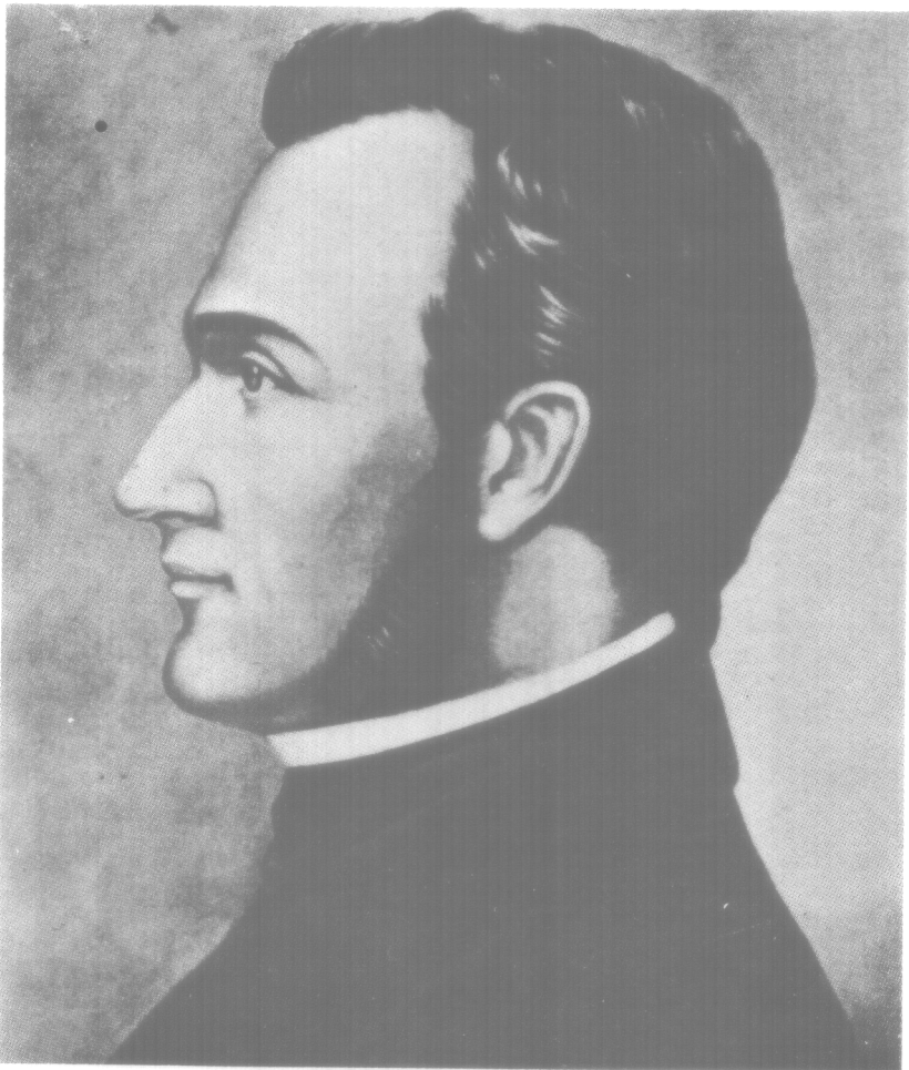
GENERAL FRANCISCO MORAZAN

Ojalá esta sugestión logre interesar a los hijos del Valle de la Luna y consiga el apoyo y respaldo de todos los americanos. Así dejaremos saldada esta vieja deuda con el inolvidable patriota hondureño, ante cuyo recuerdo hay que descubrirse y admirar su grandeza de liberal y su desprendimiento de espartano.