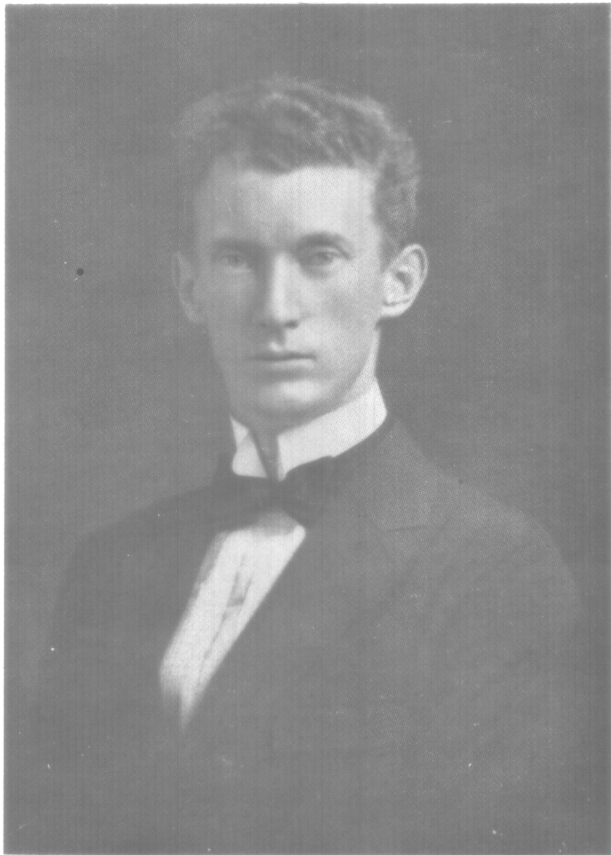
Prof. Ricardo Neuman

Esta es a cortos trazos la biografía del señor Ricardo Neuman que vino al istmo en plena juventud con el encargo de establecer una escuela para la formación de maestros que tanto necesitaba la nación panameña. De su continuo bregar en el surco nos queda su obra educacional que es imperecedera y este retrato que debe ser venerado, pues es la imagen de uno de los extranjeros que más meritorios servicios ha prestado a la República.