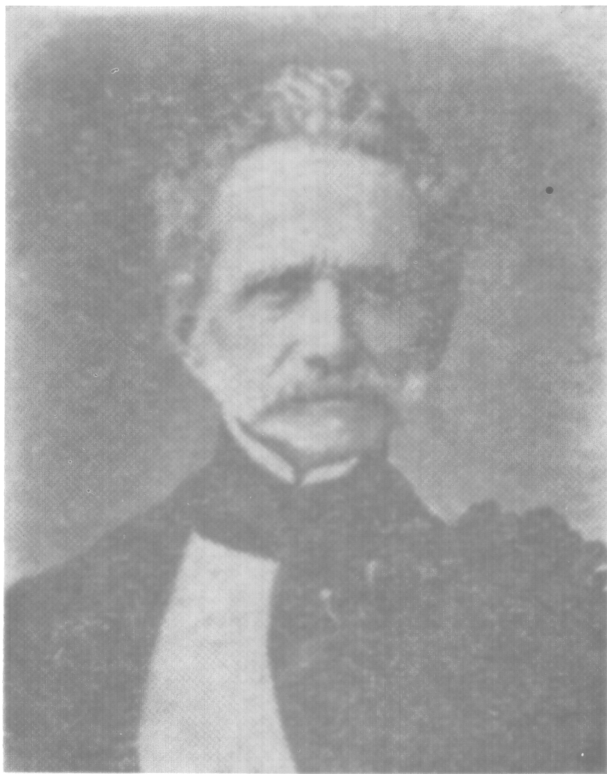
EL GENERAL TOMAS CIPRIANO DE MOSQUERA, según grabado de la época.

taron el rostro contra el suelo, no llegando a resistir el brillo de tanta luz...No olvidéis que el esclavo que se duerme sobre sus cadenas no es libre nunca. La esclavitud es una afrenta que no es permitido olvidar. Si pesan maldiciones sobre los tiranos, también pesan sobre los pueblos serviles que los toleran. Sobre los que la arrebatan y sobre los que se la dejan arrebatat, pesa el sangriento anatema del poeta: Maldito aquel que hipócrita te adore; maldito aquel que estúpido te pierda, tal escribió Vargas Vila a raíz de la agrogación del Código Radical.