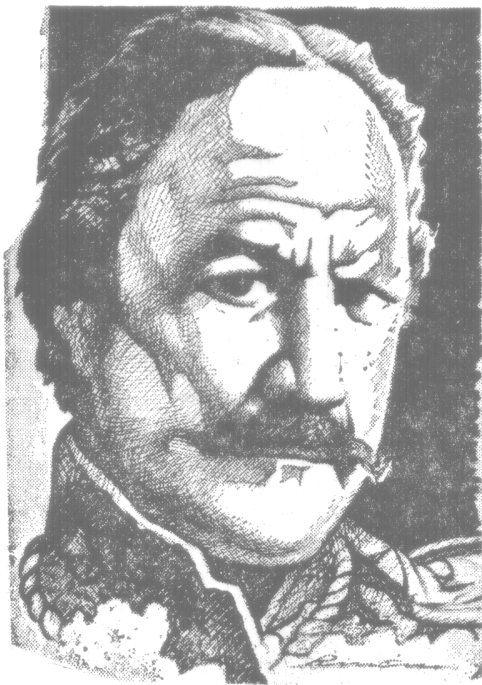
GENERAL JOSE MARIA OBANDO

Bolívar regresa del Perú en 1826. "Desde entonces Obando forma en el numeroso y aguerrido grupo de los que con el General Francisco de Paula Santander a la cabeza, le piden ahincadamente el respeto por la Constitución de Cúcuta y la no implantación en Colombia de la Carta que había escrito para la nueva República de Bolivia, considerada no solamente como de tipo monárquico, sino también inadecuada para la índole del país en el cual se pretendía que rigiera". "Vienen sucesos de todos conocidos: la propaganda al gobierno personalista; el perdón al rebelde Paéz y la Convención de Ocaña; los atropellos a los periodistas; el atentado del 25 de septiembre de 1828 y la subsiguiente represión. Fue entonces cuando los coroneles José María Obando y José Hilario López, en cumplimiento de un anhelo de restauración del régimen constitucional