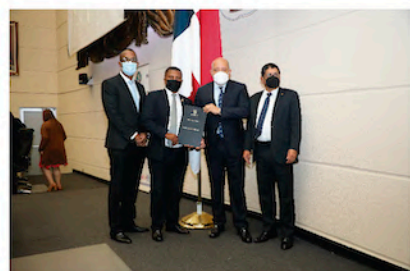
Prima de Antigüedad