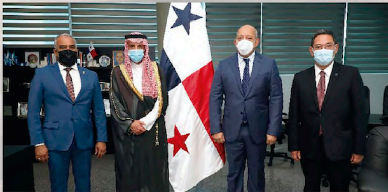
El presidente Crispiano Adames recibió la visita del ministro de Estado para Asuntos Exteriores y miembro del Gabinete Ministerial del Reino de Arabia Saudita, Adel bin Ahmed Al-jubeir, y reconoció la presencia de tan distinguido visitante, y aunque se trata de países distantes con sistemas políticos diferentes, ambas naciones coinciden en la búsqueda de la paz.