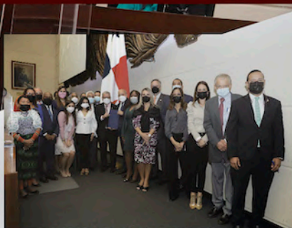
Uso medicinal del Cannabis