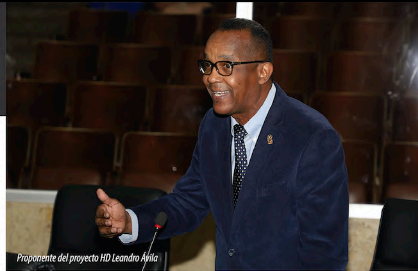
Proponente del proyecto HD Leandro Ávila

El diputado Leandro Ávila, proponente de la norma, aseguró que la mayoría de las instituciones no hicieron las reservas necesarias para hacerle frente a ese principio laboral y que mantiene en espera a más de 22 mil servidores del Estado, que algunos, a la fecha, ya están pensionados y no se han retirado porque están a la espera de dicho reconocimiento. Con esta iniciativa legal, se da la oportunidad de un sistema para el pago de la prima de antigüedad que asciende a más de B/40 millones adeudados a los actuales y exservidores públicos del país.