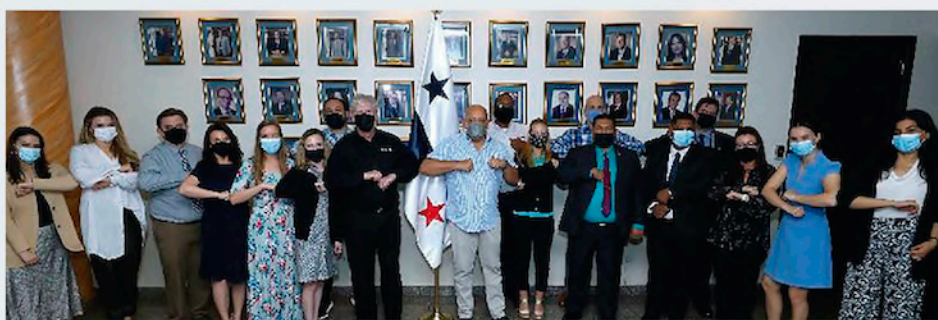
El diputado Crispiano Adames, presidente de la Asamblea Nacional, se reunió con un selecto grupo de estudiantes de Maestría en Administración de Negocios de la Universidad de Tennessee y elogió la visita de los estudiantes estadounidenses, quienes trabajan en diferentes empresas que exploran la oportunidad de ampliar el alcance de sus servicios y operaciones.