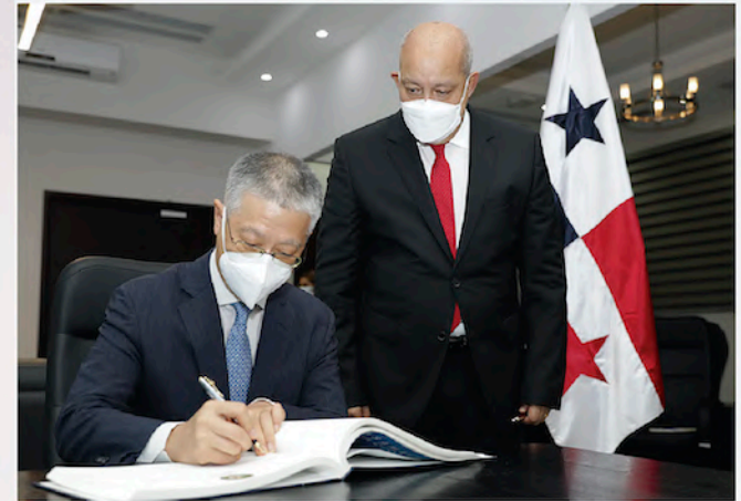
El presidente de la Asamblea Nacional, Crispiano Adames, recibió la visita de cortesía de Su Excelencia, Wei Qiang, embajador de la República Popular China en Panamá, con quien conversó sobre temas de interés bilateral.