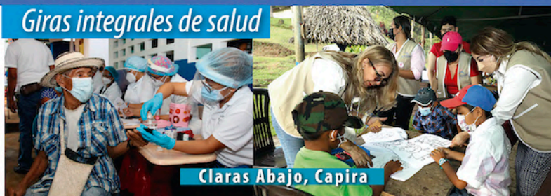
Claras Abajo, Capira