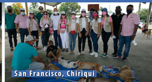
San Francisco, Chiriquí