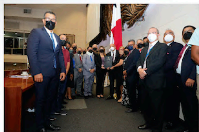
20 de Diciembre