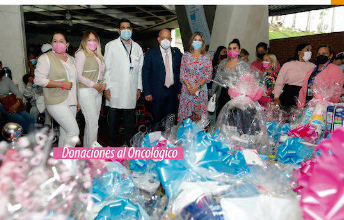
Donaciones al Oncológico

Quince fueron los panameños de diferentes provincias que se beneficiaron con una beca auspiciada por la ACONDIP para un Simposio de Turismo de Salud. Los beneficiados recibieron capacitación de expertos internacionales en masajes y terapias en spas, talasoterapia, atención en hoteles con gastronomía saludable, entre otros temas relacionados al turismo sostenible.